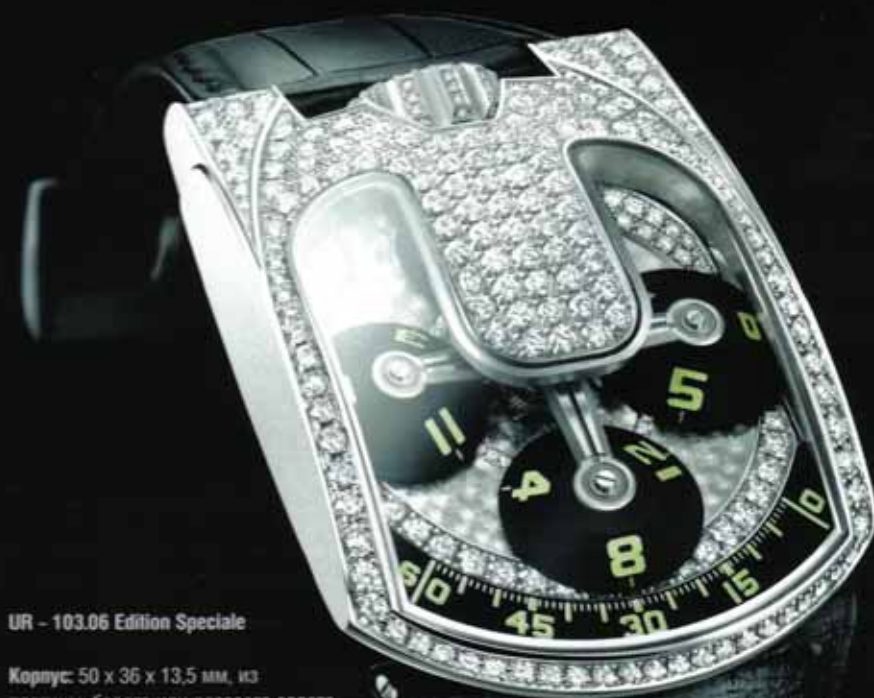
UR - 103.06 Edition Speciale

Часы Urwerk из-за своего необычного дизайна и оригинального механизма многие специалисты воспринимают не более чем коллекционные «игрушки», хотя на самом деле, конструкция каждой модели задумана так, чтобы максимально облегчить владельцу использование часов и разместить внутри себя как можно больше функций. Часы Urwerk не могут не обращать на себя внимания окружающих, хотя не оперируют ни одним из модных трендов: большим размером, яркими цветами и обилием бриллиантов. Все дело в концепции. Все три созданные молодыми женеvскими мастерами модели: UR-101, UR-102 и UR-103, выпущенные лимитированными сериями, произвели фурор. Их новые модификации практически мгновенно раскупаются, поскольку идея этих часов базируется на трех китах: необычный вид, индикация «путешествующего часа» и дополнительные функции на задней крышке корпуса.