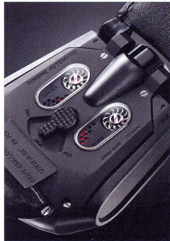
Die Rückansicht: Zwei Rädchen, sogenannte Turbinen, regeln den Automatikaufzug.

Die UR-203 verfügt ausserdem über einen neuartigen Automatikaufzug. Die auf Lagersteinen montierten Räder – Urwerk nennt sie «Turbinen» – sind mit dem Rotor ge-