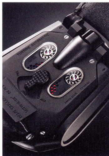
De dos: deux petites roues, appelées turbines, règlent le remontage automatique de la montre.

Par rapport au modèle précédent (la UR-202, dont le développement a nécessité trois ans de recherches...), carrousel, plots des heures, aiguilles télescopiques et cadran ont perdu 65% de leur poids, la complication affichant désormais à peine 3,57 grammes sur la balance. Nombre de ressorts, notamment, ont été remplacés par du rubis, cela afin de limiter au maximum les frottements. Ce nouveau modèle est également doté d'un indicateur d'usure de l'huile informant l'utilisateur de la nécessité d'un service technique – clin d'œil au secteur de l'automobile – et d'un «Odomètre horloger», sorte de «kilométrage» de la montre, calculant le nombre d'années