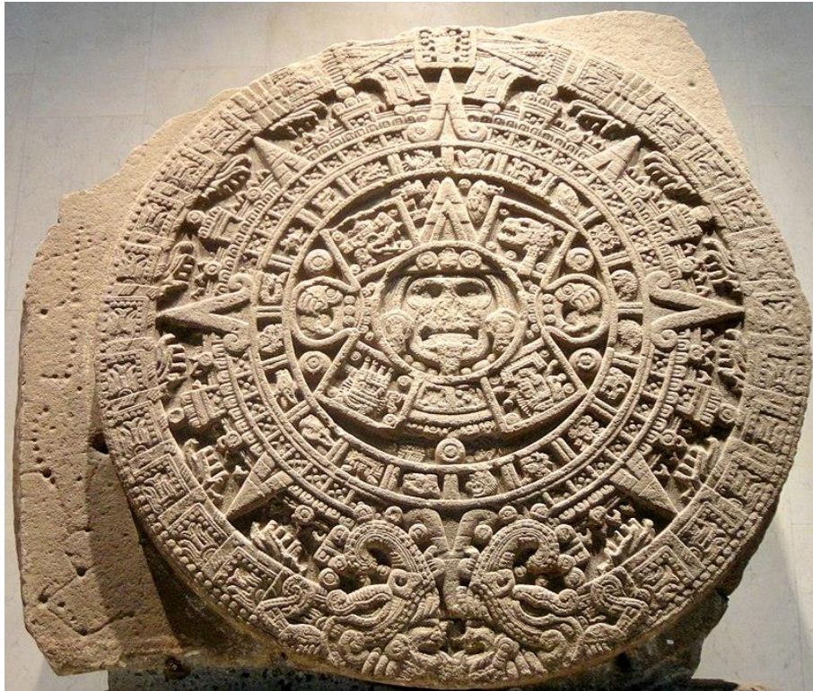
حقوق النشر محفوظة لصالح: خوان كارلوس فونسيكا ماتا

تأخذنا المحطة الأولى في خط ساعات 100V Time and Culture إلى أراضي أميركا الوسطى، وتحديداً حوالي العام 1479. حيث يتزين الجزء العلوي من واجهة هذه الساعة بنفس الزخارف التي توجد فوق "حجر الشمس" أو "Sun Stone"؛ والذي يُعد أحد أكثر أعمال فن حضارة الأزتك رمزية، وهو الآن محفوظ في "متحف الأنثروبولوجيا الوطني" في مدينة مكسيكو سيتي عاصمة المكسيك. وهذه الكتلة الحجرية المنتصبة، عبارة عن قرص منحوت يبلغ قطره 3.6 متر تقريباً، يتسم بالمهابة والضخامة. ويشير هذا العمل الفني البارح الممتن إلى تقويم شعب الأزتك؛ حيث تمثل الدائرة الثالثة التي يصورها النحت عدد أيام الشهر البالغة 20 يوماً، بينما تمثل الدائرة الرابعة عدد أيام السنة البالغ 260 يوماً.